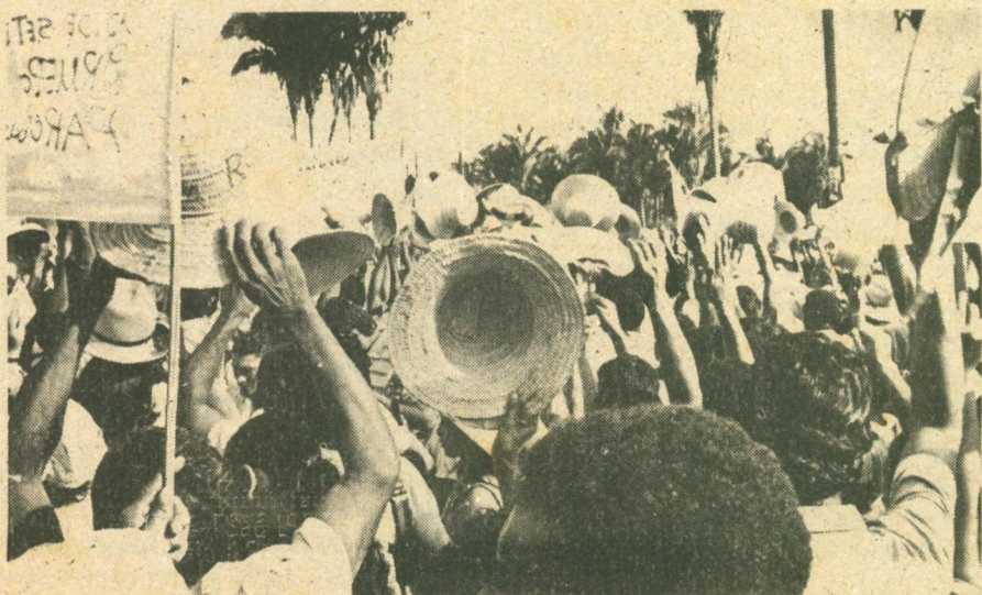
Vargem Grande: 1ª ROMARIA DA TERRA/1986

Ref: Virá o dia em que todos/ ao levantar a vista/ veremos nesta terra/ reinar a LIBERDADE (bis)