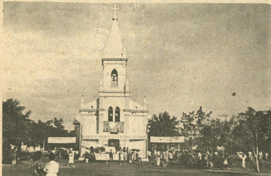
BACABAL: Igreja de Santa Teresinha, aquí vai encerrar a Romaria.

Lugar nunca foi problema para romeiro, pode ser qualquer, desde que seja sagrado. Bacabal é lugar de muita luta e de muita fé dos lavradores. Nós vamos lá para levar nossa luta e nossa teimosia aos pés de Santa Teresinha, que foi pessoa pequena e simples que lhes realizou muitas coisas: Deus está com os pequenos.